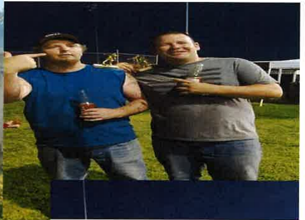
Horse Shoe Tournament - Third Place