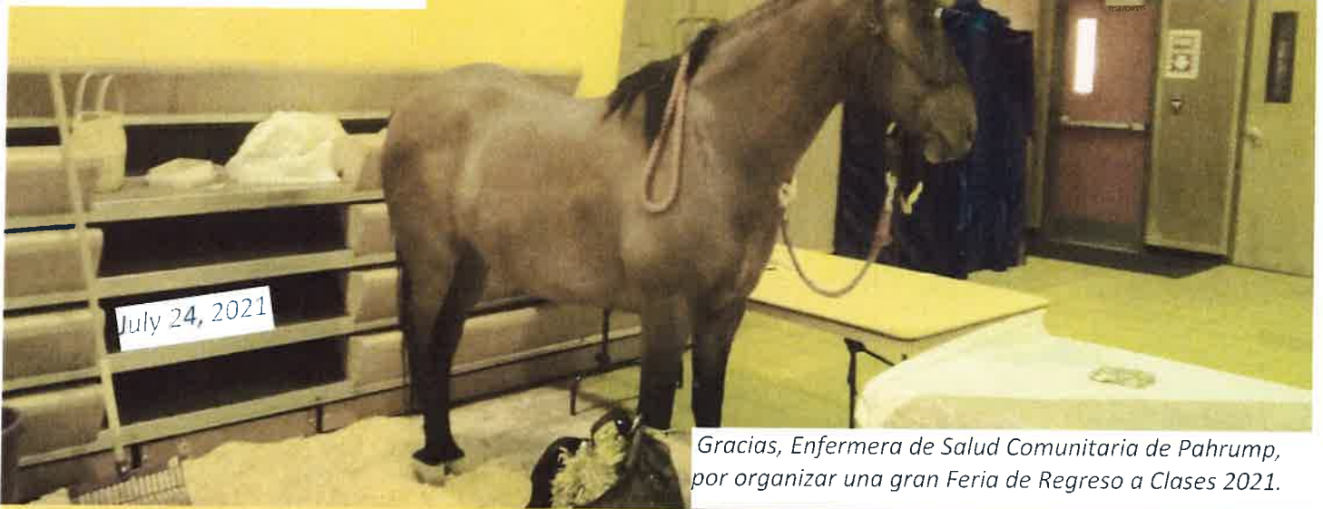
Gracias, Enfermera de Salud Comunitaria de Pahrump, por organizar una gran Feria de Regreso a Clases 2021.