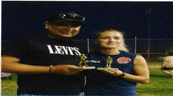
Horse Shoe Tournament - Second Place